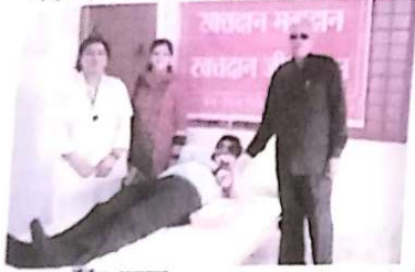
मुख्य मॉनिंग, अनूपपुर

शासकीय तुलसी महाविद्यालय में राष्ट्रीय सेवा योजना के अंतर्गत रक्तदान शिविर का आयोजन किया गया।